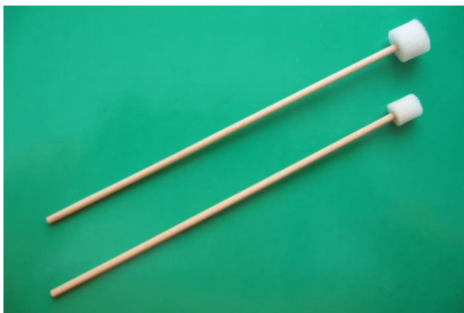
GOBICE OKROGLE MINI IN NORMAL